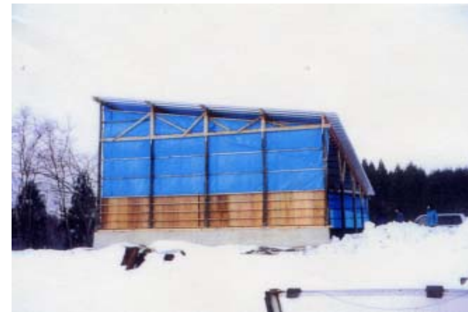
屋根の傾斜を前に用いることにより、除雪作業がスムーズになった。