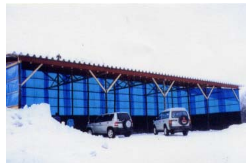
柱の間隔を大きくとり、大型ローダーでの切り返しが可能となった。