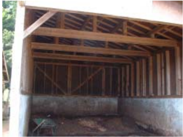
梁に跳ね材を利用