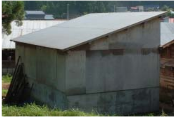
堆肥舎(後面) 木造～片流れ屋根