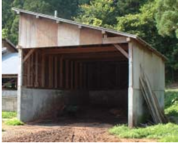
堆肥舎(前面) 自力施行

堆肥利用コメント 当該農家では耕畜連携を今後も継続していけるように、良質完熟堆肥生産に努めている。また、堆肥の成分分析を検討しており、肥料成分を把握し畑作農家が使いやすい堆肥づくりを行うこととしている。