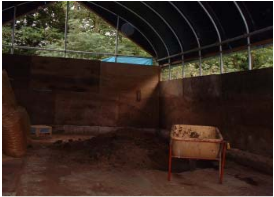
パイプハウス堆肥舎の内部