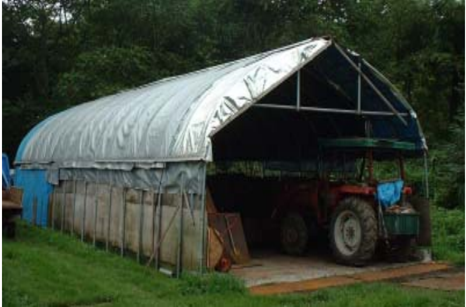
パイプハウス堆肥舎(前面) 自力施行

堆肥利用コメント 良質な堆肥づくりに努めており、生産堆肥は近隣畑作農家からの需要が多く、春先はほとんど残っていない状況である。