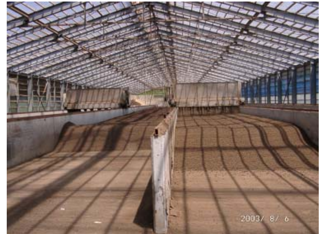
堆肥化施設は開放回行型で、ロータリー型攪拌移送機械が稼動。副資材(もみがら)は十分な量が投入されており、円滑に堆肥化が進んでいる。施設内外に悪臭はほとんど感じられない。