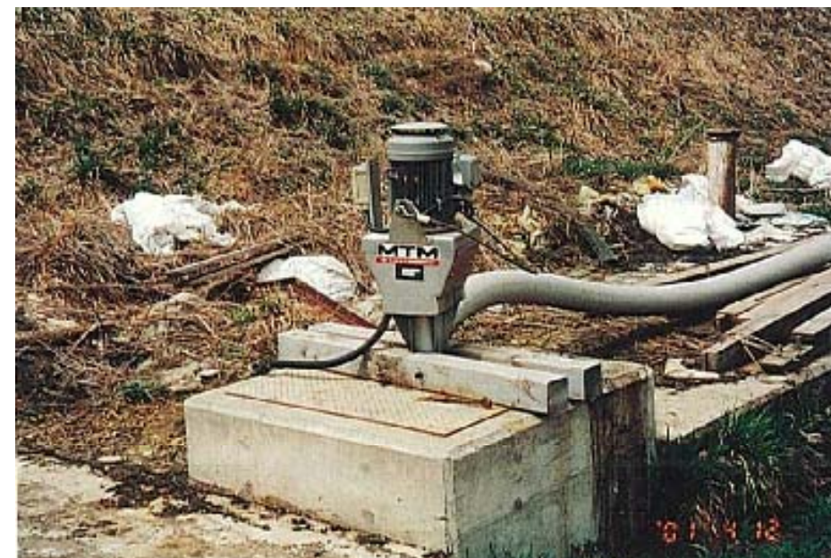
尿溜め及びばっき装置