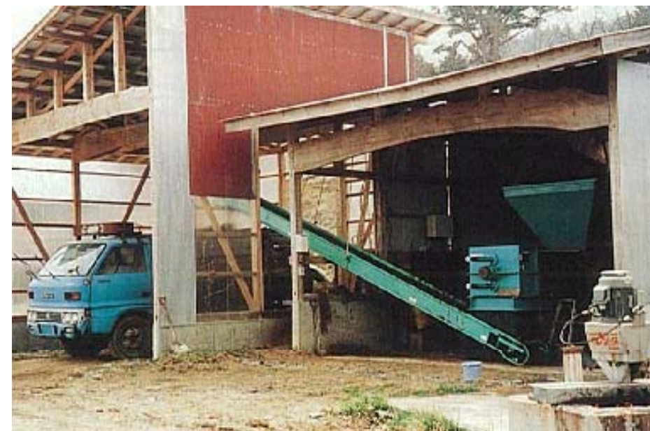
右奥が固液分離機、手前が尿溜め及び曝気槽 バークリーナーからの糞尿が、固液分離機に入り、固形分はトラックへ、液体は尿溜めに入るように設置

堆肥利用コメント 固液分離機により、低水分で良質な発酵が行われている。 水分は貯留槽において曝気処理した後、自己所有農地に散布している。