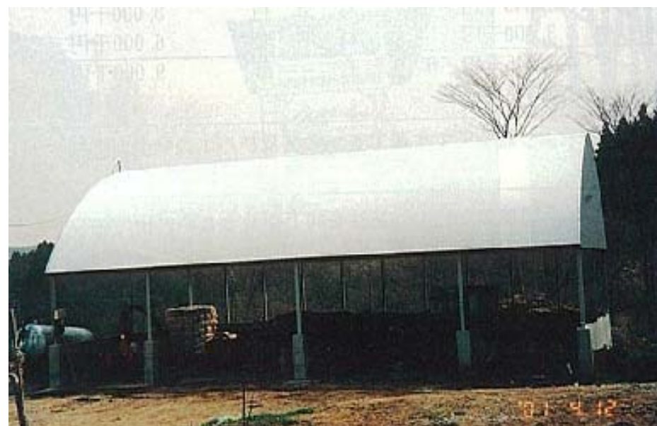
堆肥舎全景 中仕切り無し