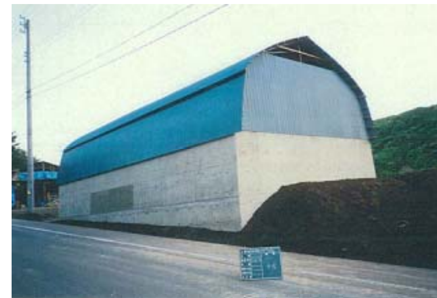
右側斜め後方から