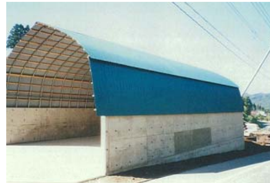
右側斜め前方から