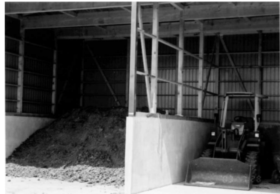
堆肥舎の内の状況