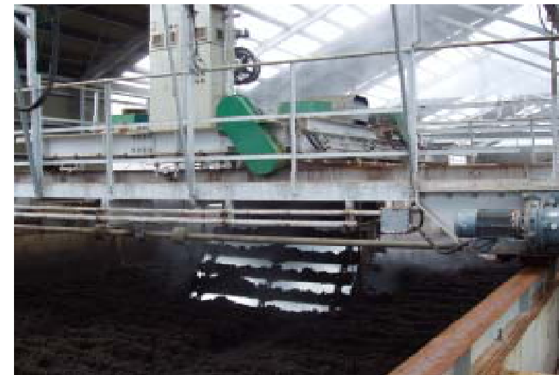
スクープ型攪拌移送機 幅2.5mのスクープが1日に12時間かけて 合計6往復し、堆肥は1日に2m移動する。