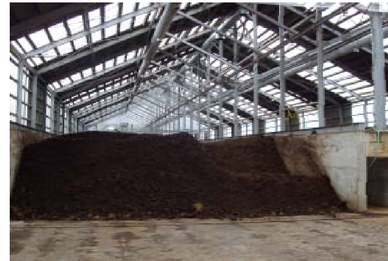
堆肥化施設内部 発酵槽は間口7.5m×高さ2mが2槽。 1日投入量は30㎡×2槽。 投入から3週間で堆肥化を行っている。