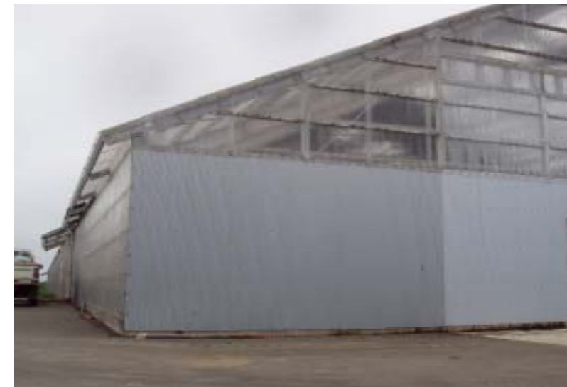
堆肥化施設概観 鉄骨造り。 屋根や壁は日光をたくさん取り入れ、 堆積物表面からの水分蒸発を促進する よう半透明部分が多くなっている。