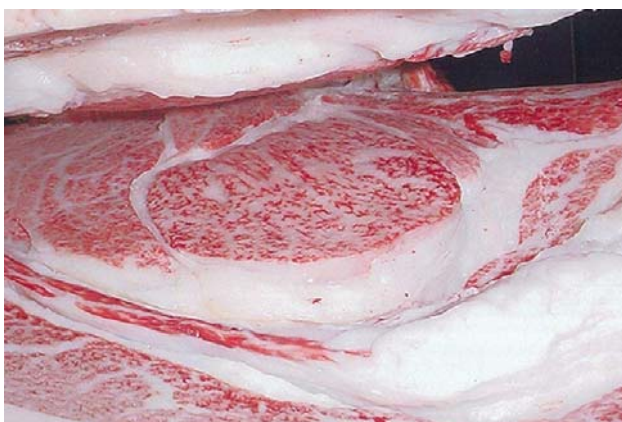
第5回全農枝肉共励会名誉賞(平成15年7月11日) 去勢(第1花園×安福165の9×恒徳) 506kg BMS12