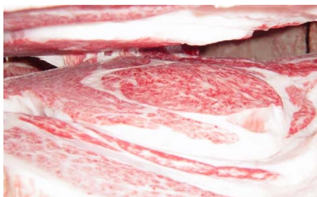
第9回全農肉牛枝肉共励会 優秀賞(平成19年7月6日) 去勢(国栄97×安平×隆桜) 561kg BMS12