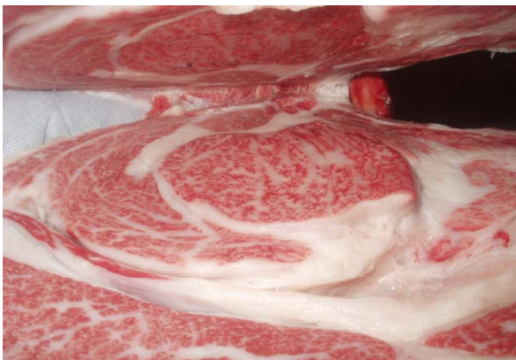
第21回東北牛匠会枝肉共進会名誉賞(平成17年8月2日) 雌(照神12×第1花園×北国7の8) 434.5kg BMS12