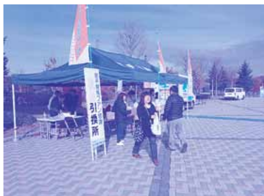
特設テントでの畜産物の引き替え