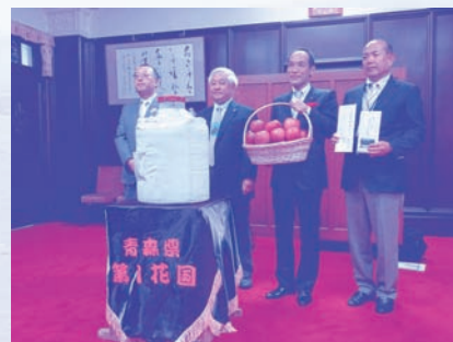
宮崎県で行われた贈呈式