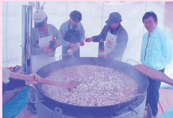
シャモロックの生産者が鍋づくり