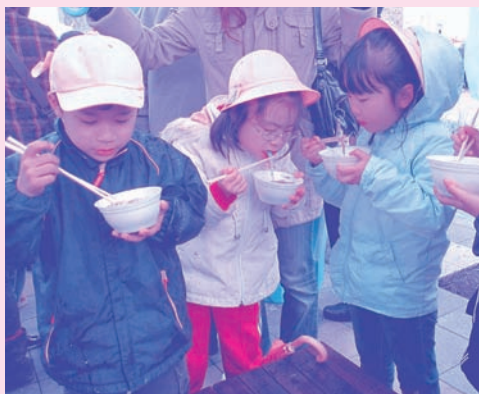
ふーふーしながら食べました