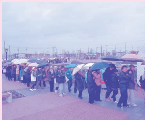
試食にならぶ長蛇の列