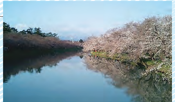
[写真：弘前公園 西堀]

この連休、安心して桜を愛でることが出来るよう願っております。「協会だより」は月一回発行したいと考えており、今後とも内容を充実させるよう、努めて行きますので御協力をお願いします。