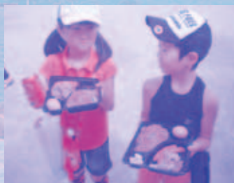
「ありがとう」と笑顔がこぼれる