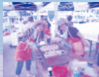
青森シャモロックも大好評