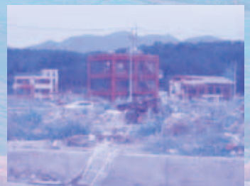
復興は進むも、まだ爪痕が残る