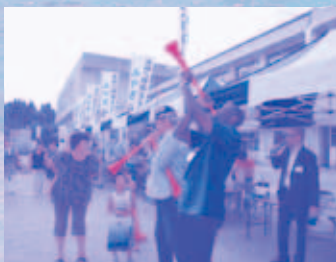
ブブゼラを教える大使たち

また、今回のイベントにはアフリカからの支援もあり、多くの在日大使が来場し、ブブゼラの吹き方を教えるなど被災地の子供たちと交流を図った。