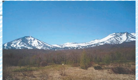
〔青森市：残雪の八甲田〕

口蹄疫の発生に苦しむ農家を支えるため、各地から義援金が集まる中、宮崎県西都市で義援金詐欺事件が発生しました。このような人の弱みにつけ込む行為は許しがたく、このようなことが無くなるよう、一日も早い口蹄疫の終息を願っております。今号は、家畜自衛防疫対策を特集しました。参考として下さい。