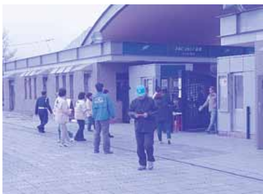
入場ゲートでの引換券配布

本県は「飲むヨーグルト」2個、200セットを入場に配布した引換券と競馬場内の特設テントで交換し入場者から好評を得ました。